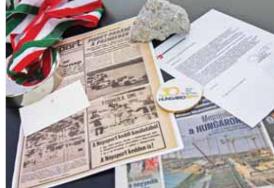
Különleges mementók kerültek a kapszulába

Időkapszulát helyeztek el a Formula–1 Magyar Nagydíjnak otthont adó Hungaroring leendő főépületének alapjában. 2026-ban fejeződik be a létesítmény felújítása.