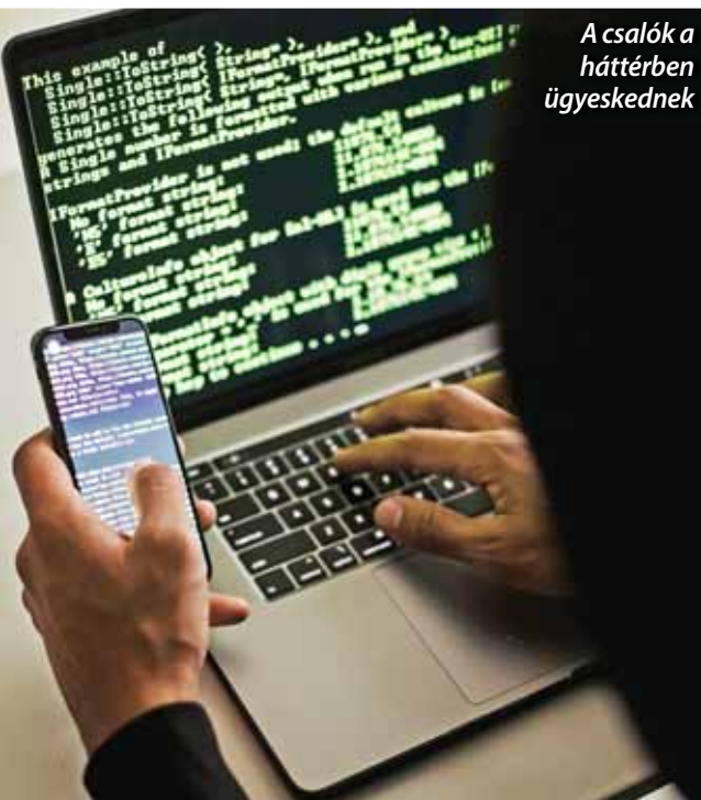
A csalók a háttérben ügyeskednek

– Az ajtóim mindenki előtt nyitva áll, ha bármilyen szakmai vagy egyéb nehézség adódik, biztatom a kollégákat, hogy minden esetben nyugodtan forduljanak hozzám – mondta.