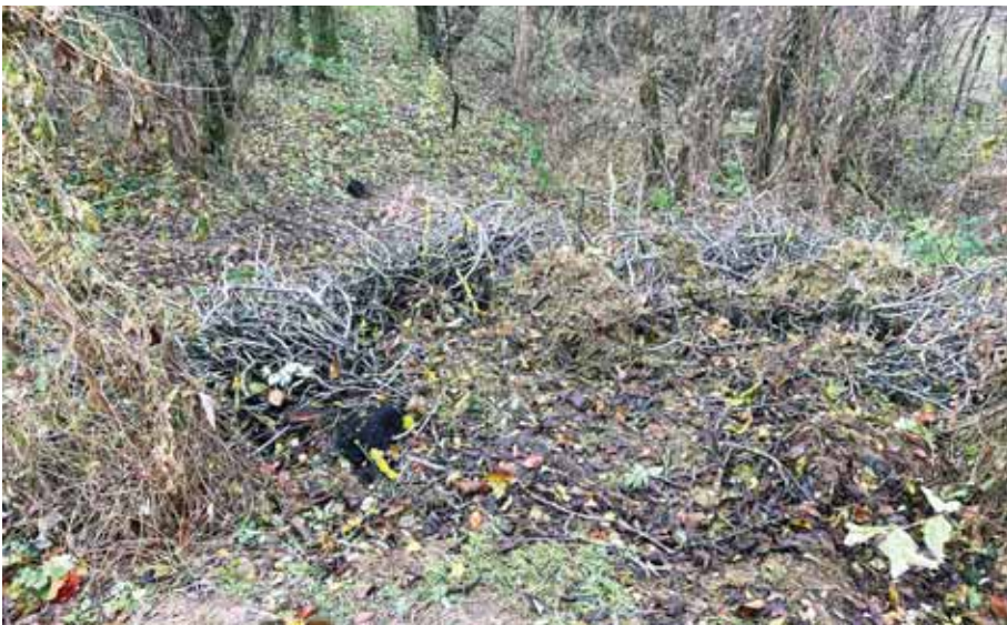
Az otthoni zöldhulladékot inkább komposztáljuk, ha lehet

Akár télen, akár más évszakban a felhalmozódó kerti zöldhulladéknak sokkal jobb helye van az otthoni komposztálóban, mint eldobva az erdő közepén vagy szélén. Ugyanígy más szemét sem való oda. Gondolatok az erdei környezet tisztaságáért.