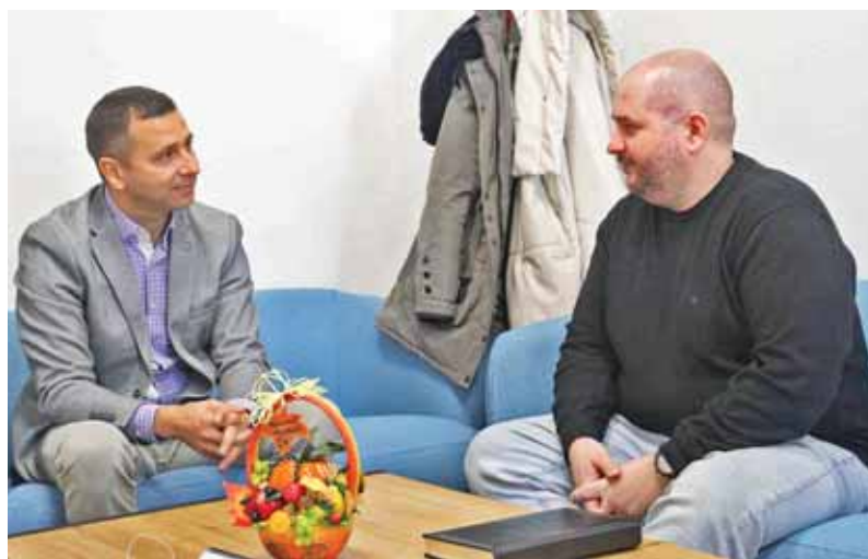
Partneri a kapcsolat

Az egyeztetésen felmerült, hogy a rendőri jelenlét növeléséhez Szada polgármestere és közterület-felügyelete is partner lenne a közös járőrszolgálat biztosításá-