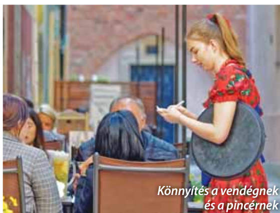
Könnyítés a vendégnek és a pincérnek

A magánszemélyek fogyasztására vonatkozó 15 százalékos maximális mérték a kisebb forgalmú, jellemzően családi vendéglátó egységek versenyipiaci helyzetének erősítéséhez járul hozzá. Ezek a szolgáltatók ugyanis a díjjal járó adminisztrációs terhek miatt korábban hátrányba kerültek a korlátlanul magas felszolgálati díjakkal üzemelő vendéglátóhelyekkel szemben.