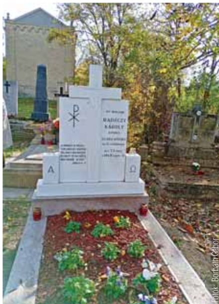
Megszépült a sírhely

Mindenütt a közösségért dolgozott, iskolát, templomot és a tanítónővérek számára lakóházakat építtetett, ifjúsági egyesületet szervezett. Nem nehéz meglátnunk a közösség-szervező papban mai közösségünk alapítóját. Huszonegy év szolgálat után hazatért Magyarországra. Szadára