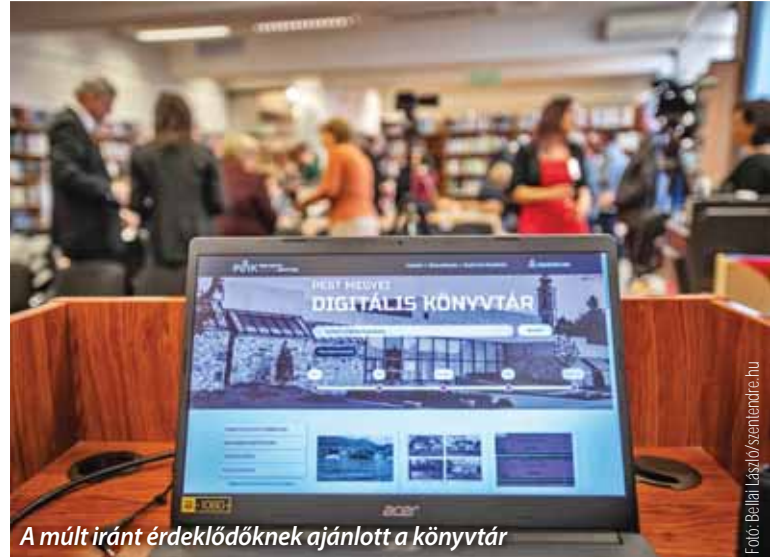
A múlt iránt érdeklődőknek ajánlott a könyvtár

Pest vármegye páratlan szellemi örökségének, kulturális kincseinek minél nagyobb szelvéhez férhessenek hozzá otthonról is a felhasználóink, ezért mi magunk is folyamatosan digitalizáljuk a helytörténeti tárunkban lévő dokumentumokat. Másrészt azt is célul tűztük ki, hogy a digitális könyvtárban más intézmények, de akár magánszemélyek is elhelyezhessék a helytörténeti szempontból jelentős tartalmaikat, hozzájárulva egy közös tudásbázis építéséhez. A könyvtár küldetése közé tartozik a Pest vármegyei települések emlékezetének, a helyi személyek neveinek fenntartása az utókor számára. A települések lapjai, fotói, saját könyvei fontos részei a nemzeti emlékezetnek, a digitális könyvtár pedig méltó tárhelye e kordokumentumoknak.