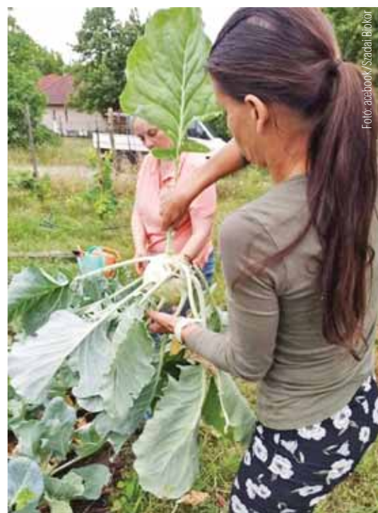
Más természetesi elvek vannak

Miért ez a nagy érdeklődés, tanulni vágyás a biodinamikus módszer iránt? Hiszen már többféle öko-, bio-, permakulturás stb. termelési módot ismerünk. Száz évvel ezelőtt a Rudolf Steiner által bemutatott korszerű mezőgazdasági elvek hívták fel a figyelmet – a tápanyagukban gyengülő élelmiszerek kapcsán – a mezőgazdaság organikus vagy ökológikus megközelítésére. Azonban a biodinamikus módszer mégsem terjedt el igazán. A speciálisan készült