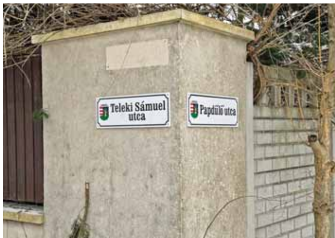
Egységes arculatú utcanévtáblákat helyeznek ki