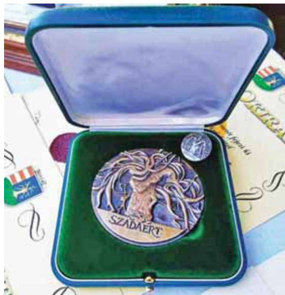
Impozáns darab a kitüntető díj

ját az a közösség kaphatja, amely többéves (5–10 év) tevékenységével növelte Szada hírnevét, illetve, amely a településért, a település közösségéért kiemelkedő munkát végzett.