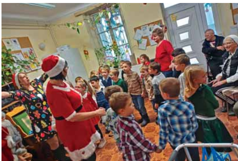
A Süni csoport az idősök otthonában

Az advent, a Mikulás és a karácsony jegyében telt az elmúlt év decembere a Székely Bertalan Óvoda-Bölcsődében. Sok-sok sütemény, játék és élmény volt az ünnepi meglepetés.