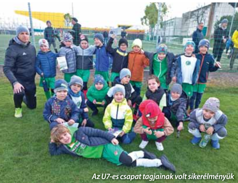
Az U7-es csapat tagjainak volt sikerélményük

A Szadai SE felnőtt labdarúgócsapata a Pest vármegyei bajnokság III. osztályának Keleti csoportjában szerepel 2024/25-ben. A rossz rajt ellenére a gárda a hetedik helyen végzett az őszi záráskor. A még jobb folytatásban bíznak.