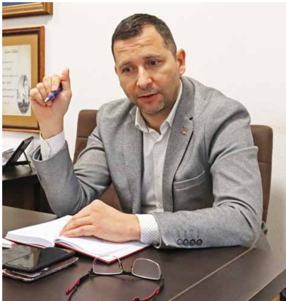
A település vezetője az óvatos tervezés híve

Ami pedig a szolidaritási hozzájárulást illeti... Ennek a mértékét az egy lakosra jutó adóerő-képesség alapján határozzák meg. Azoknak az önkormányzatoknak kell fizetniük, amelyek jelentős iparűzésiadó-