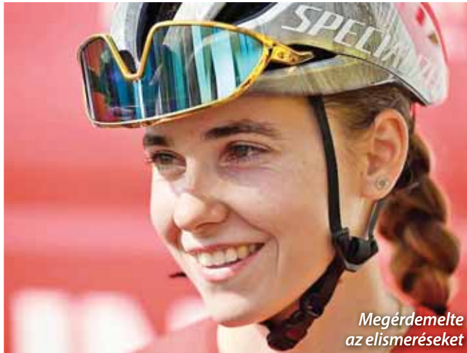
Megérdemelte az elismeréseket