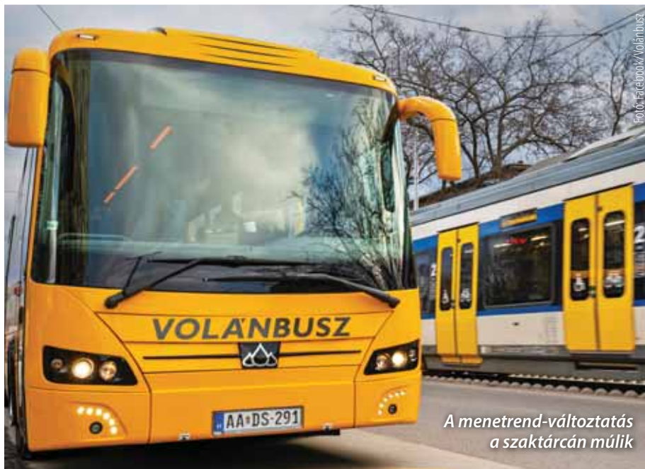
A menetrend-változtatás a szaktárcán múlik