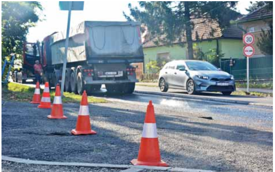
A közutak állapotának javítása kiemelt feladat marad

– Ha már a 2025-ös helyi költségvetés szóba jött: a megmaradó forrásból milyen fejlesztések megvalósítását tervezik erre az évre?