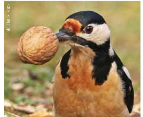
A harkály is fontos része az ökoszisztémának

A közösségek és az önkormányzat felelőssége pedig, hogy az erdőben a megfelelő, a természetvédelemmel és a közjólléttel összhangban lévő gazdálkodási formát válassza. A klímaváltozás miatt elsődleges szempont lett, hogy az erdeink legyenek ellenállóak az időjárási szélsőségekkel és a kórokozók, betegségekkel szemben.