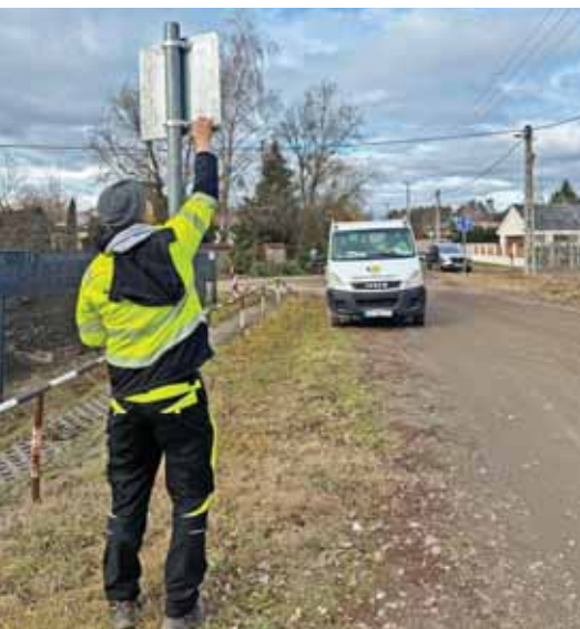
A hibás darabokat kicserélik

Kezdeként a Fenyvesligetben indult el az a forgalomtechnikai munka, amelynek célja a közlekedési rend minél átláthatóbbá, használhatóbbá tétele Szada teljes területén.