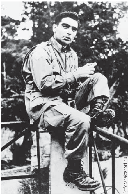
Robert Capa világhírűvé vált fotóival

A 2025. január 1-től hozzáférhető gyűjteményrész a kultúra és a tudomány terén tevékenykedett, 1954-ben elhunyt szerzők életművéből merít. Herceg Ferenc (1863–1954) a két világháború közötti időszak egyik legnépszerűbb magyar írója, akinek Az élet kapuja című regényét háromszor is jelölték irodalmi Nobel-díjra. Drámái és regényei a magyar és nemzetközi színpadokon is maradtak. Nagy Lajos (1883–1954) a satirikus próza mestere, a Nyugat főmunkatársa és többszörös Baumgarten-díjas író, aki a novelláival vált igazán ismertté. Robert Capa (1913–1954) világhírű magyar-amerikai fotográfus és haditudósító, a 20. század egyik legjelentősebb dokumentaristája. Fényképei máig a háborús fotográfia ikonikus alkotásai. Gerevich Tibor (1882–1954) a művészettörténet és kultúrpolitika kiemelkedő alakja, akadémikus, akinek munkássága a magyar és nemzetközi műemlékvédelem területén is meghatározó. Husztai József (1887–1954) a klasszika-filológia és a magyar humanizmus jeles kutatója, aki többek között