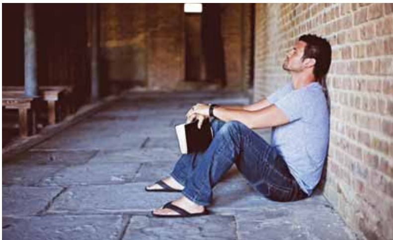
A hit átsegíthet a nehezebb élethelyzeteken

Azt mondja a Biblia: „ Én, az Úr vagyok a te Istened, arra tanítalak, ami javadra válik, azon az úton vezetlek, amelyen járnod kell. ” (Ézsaiás 48:17) Az biztosan a javunkra válik, ha tudatában vagyunk annak, hogy az élet többről szól, mint az a 60, 70, 80 év, amit itt töltünk. Ebben az évben is biztosan lesznek örömek és nehézségek. Nem tudjuk, mit tartogat ez az esztendő. Isten soha nem ígérte, hogy könnyű lesz, arra van ígértünk, hogy nem hagy magunkra bennünket.