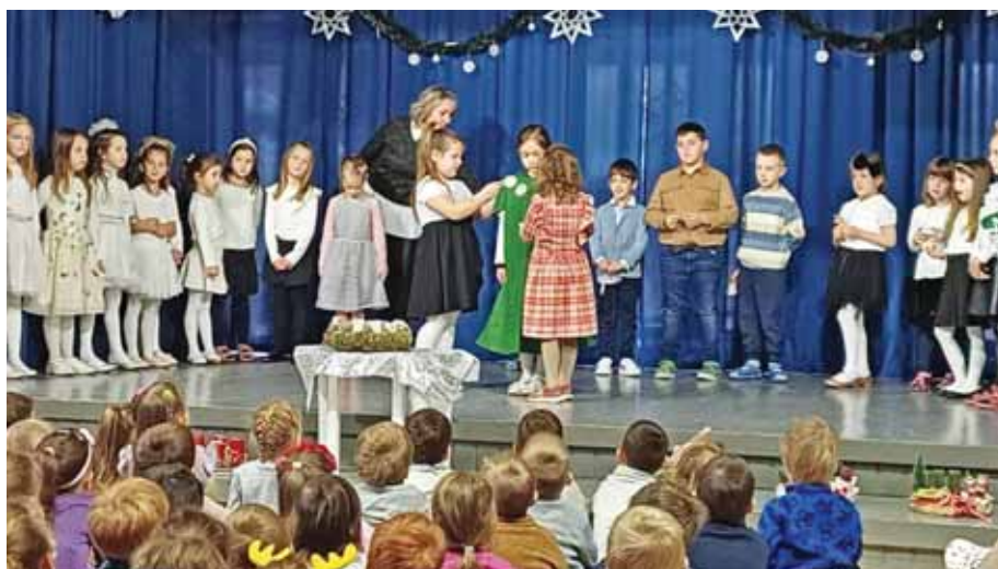
A Maci csoport karácsonyi előadása