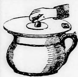
Pot de chambre.