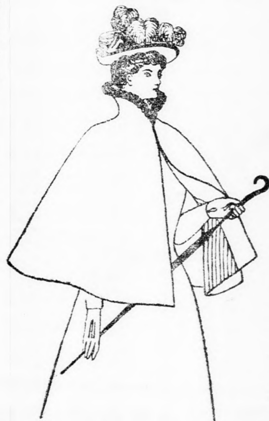
Gallérok, a legújabb fazon szerint a legolcsóbbtól a legfinomabbig a legnagyobb választókban Kovách Gedeonnál Nagy-Becskeken. 816/e-x-3

Különlegességek: Jerikó, édes Emaus, Jeruzsálem, Hebron; herb à la Bordeaux.