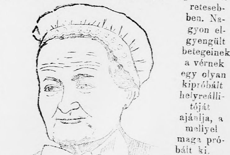
reteseben. Nagyon elgyengült betegeinek a vérnek egy olyan kipróbált helyreállítóját ajánlja, a melyet maga próbált ki.