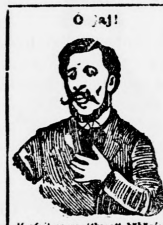
Megfolt az az átkosított köhögés!

Köhögés, rekedtség és elnyálkásodás ellen gyors és biztos hatásúak Egger mellpasztillát, az étvágyat nem rontják és kítőző ízűek. Doboz 1 korona és 2 korona. Próbadoz 50 fillér. Fő- és szétküldési raktár: „NADOR” Gyógyszertár Budapest, VI. ker., Váci-körút 17. szám.