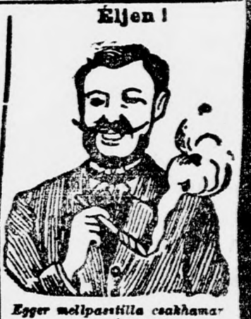
Egger mellpasztilla csakhamar meggyógyított.

Köhögés, rekedtség és elnyálkásodás ellen gyors és biztos hatásúak Egger mellpasztillát, az étvágyat nem rontják és kítőző ízűek. Doboz 1 korona és 2 korona. Próbadoz 50 fillér. Fő- és szétküldési raktár: „NADOR” Gyógyszertár Budapest, VI. ker., Váci-körút 17. szám.