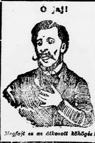
Megfojt és az átkosított köhögés!

Köhögés, rekedtség és elnyákosodás ellen gyors és biztos hatásúak