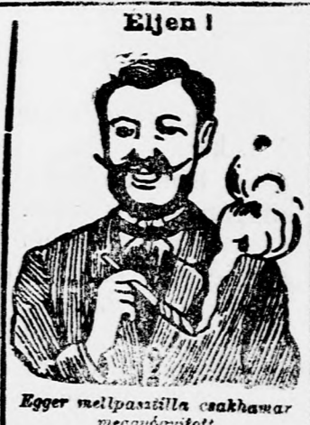
Egger mellpasztilla csakhamar meggyógyított.