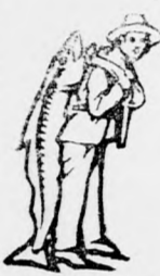
Az Emulsió készítésénél a SCOTT-féle módszer végezték — a halászt — körük ügyelőbe venni.

bármily makacs és hosszadalmas is legyen az, a SCOTT-féle Emulsió gyorsan megszüntet. Még a sorvadásos betegeknek is könnyebbülést szerez a SCOTT-féle Emulsió, feltéve, hogy idejekorán használják, mely esetben állandó, tartós gyógyulást eredményez.