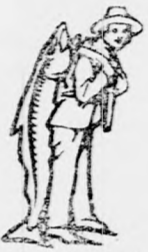
Az Emulsio vásárlásánál a SCOTT-féle módszer védelmét — a halászt — kérjük figyelembe venni.

különösen lábadozóknál, vagy vérszegénység, tüdőbaj, túlterhelt munkából származó betegségek folytán az elővigyázatos ember azonban ahhoz a szerhez folyamodik, mely számtalan esetben, kivétel nélkül hatásosan és biztosan gyógyítja a gyengeséget. Ez a szer a SCOTT-féle Emulsio. (2 o e—3.2)