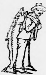
Az Emulsió készítésénél a SCOTT-féle módszer védelmet — a halast — közzégyeltembe veszi.