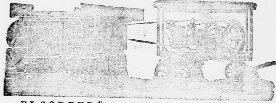
ELSORENDÜ SZOLID GYÁRTMÁNY

Árjegyzékkel és költségvetéssel díjmentesen szolgálunk.