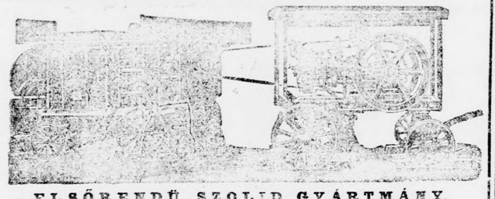
ELSŐRENDŰ SZOLID GYÁRTMÁNY

Árjegyzékkel és költségvetéssel díjmentesen szolgálunk.