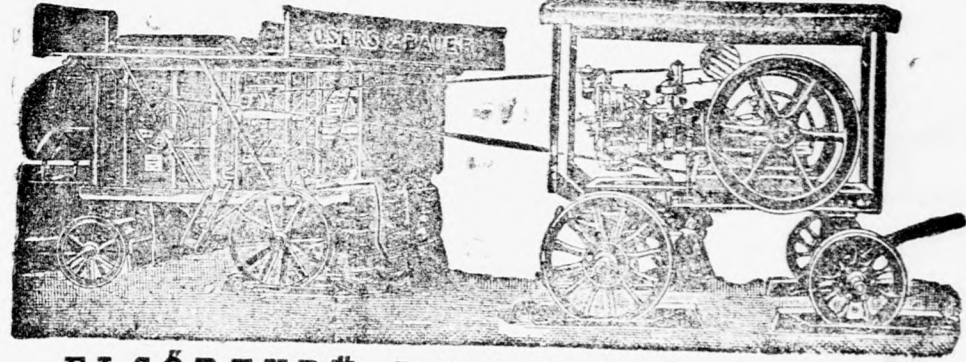
ELSŐRENDŰ SZOLID Gyártmány.

Arjegyekkel és költségvetéssel díjmentesen szolgálunk.