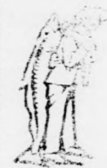
Az Emulsio készítésénél a SCOTT-féle módszer vezet a halásztól a kórházig a legelőnyösebb úton.