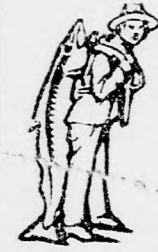
Az Emulsio vásárlásánál a SCOTT-féle módszer vedjégét (a balászt) kérjük figyelembe venni