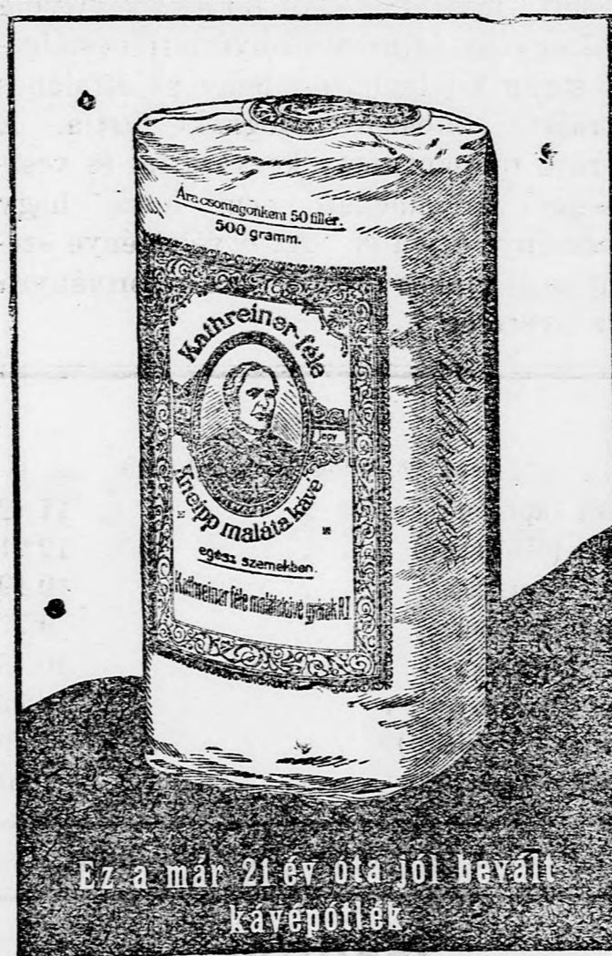
Ez a már 21 év óta jól bevált kávépótlék

Veritékező polgártársam, te kisvárosban, akár Nagybecskereken is, bizonyára voltál már oly társaságban, ahol egyetlen egy ur vagy asszony beszél a Darvainé seylembuza helyett Strindberg Ágoston színműveiről, amikor is a többi harminc ur vagy asszony egy árva szót sem beszélt. Bizonyára azt is tudod, hogy ezt az elhagyatott, boldogfalan urat, vagy azt a szegény, jobb sorsra érdemes nőt a hallgató harminc irodalmi smokknak tekintették, sőt azzal az ironiával, amelynek szava hasonzorü emberek között mindjárt szentté lesz, annak is keresztelték. Az a beszélő egy és az a hallgató harminc és az a keresztelő szent ironia: röviden magyar kisvárosnak nevezetik, hol tízezer, hol pedig huszonötezer lakossal... — edl.