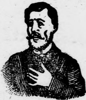
Megfőjt ez az átkesett köhögés.

és elnyálkásodás ellen 1005-20.0 gyors és biztos hatásnak