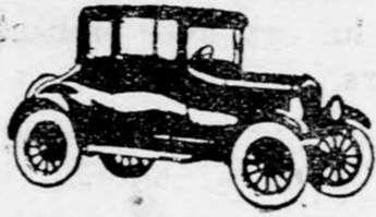
Coupé, 2 ülésel Din 52.000

Amellettt minden Ford képviselő azonnal s állíthatja Önnek a kívánt típust. Nem kell hiába várnia hónapokon át.