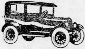
Sedan, 5 ülésel Din 55.700