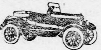
Sportkocsi, 2 ülésel Din 37.400