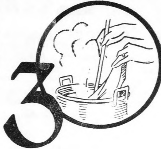
3 A fehérneműt lazán a hideg oldatba beletenni és lassan felforni hagyni. ¼ órai főzés elegendő.