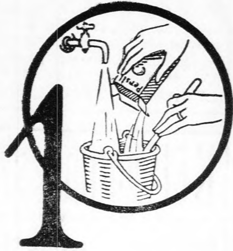
1 A Persilt hideg vízben feloldani.

és csináld helyesen! Nagyon egyszerű és mégis fontos: