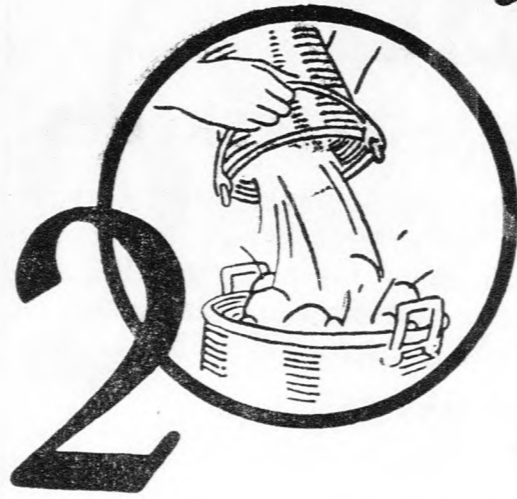
2 A felkevert oldatot hideg vízzel telt főző edénybe tenni.