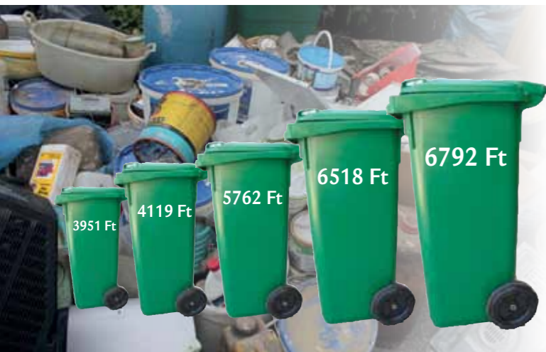
A 120 literes edények ürítési díjának változása máig

A Saubermacher azonnal és visszamenőleg emelt volna, de Batorbágy ellenállt, így valamelyest sikerült lefékezni a 2012. évi árnövekedést. Ennek ellenére az egy évre meghosszabbított szerződés értelmében decemberre közel a duplájára emelkedtek városunkban a lakosság által fizetendő kukadíjak.