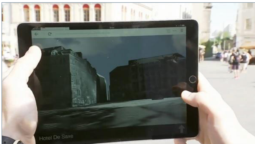
2. ábra: 4DCity-megjelenítő Drezdában 30

A forgatókönyv keretén belül készült egy 4D-Viewer (4D-megjelenítő), a 4DCity, 28 ami történelmi városok időben változó virtuális 3D-s lenyomatait teszi vizuálisan elérhetővé asztali és mobil eszközökön, valamint AR- és VR-szemüvegeken keresztül. Továbbá a Drezdai Műszaki Egyetem és a Würzburgi Julius-Maximilians Egyetem együttműködésében kifejlesztettek egy eszközt, a 4D-Browser-t 29 (4D-Böngésző), amelynek célja, hogy Drezda városának digitális 3D-modelljeit 1500 történelmi fotóval gazdagítsák, és kiegészítsék a lerombolt vagy megjelenésében megváltozott épületek 3D-s modelljeivel. Egy hozzáadott idővonal segítségével négy dimenzióban mutatja be a várost és a város építészeti fejlődését. Az általános online fényképadatbázisokkal ellentétben a 4D-Browser innovatív és interaktív hozzáférést kínál a történelmi fényképekhez, lehetővé téve a felhasználók számára, hogy térben és időben keressenek a fotók között.