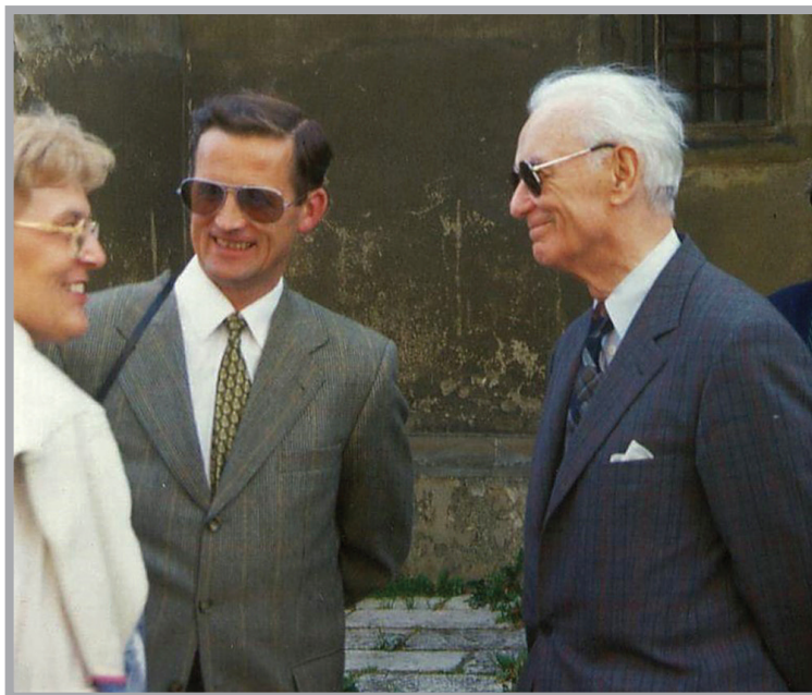
Egy Lőcsén rendezett konferenciához kapcsolódó kiránduláson 1998 szeptemberében