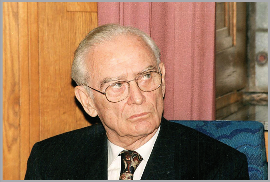
Díszdoktorrá avatás a JPTE-n (1999)

századi pápai oklevelek feldolgozását tűzte ki célul. 2 Egyháztörténeti munkássága eredményei nyomán mentességet kapott a lelkészek számára előírt gyakorlat alól, 1959-ben evangélikus lelkészé szentelték, de a történeti kutatások ekkor már annyira meghatározóak lettek az életében, hogy lelkészi pályán soha nem működött.