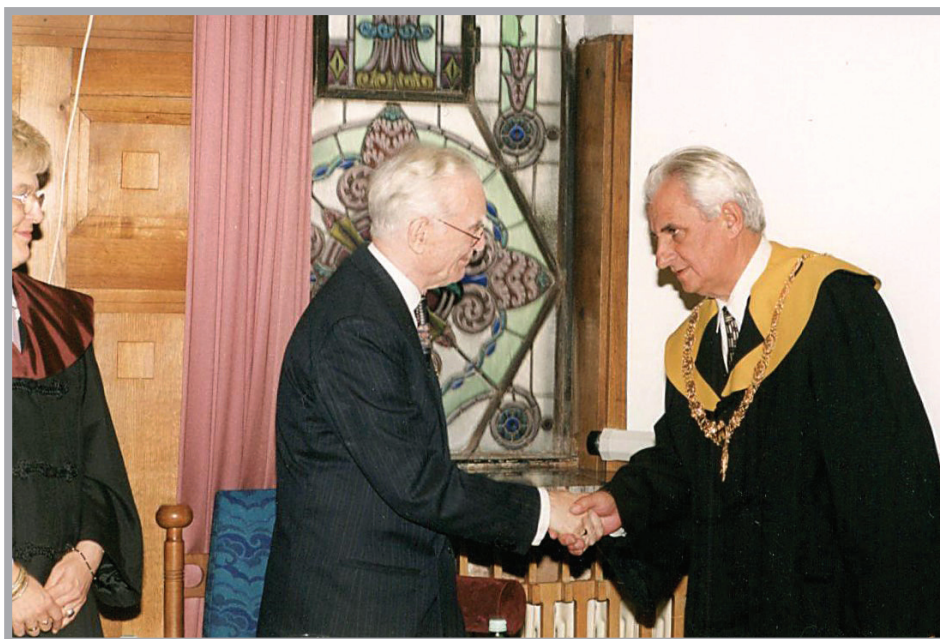
Díszdoktorrá avatás a JPTE-n (1999)