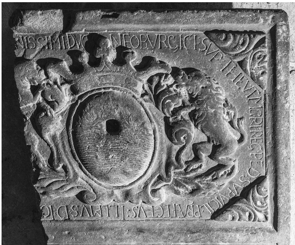
A címerpajzs és a körirata