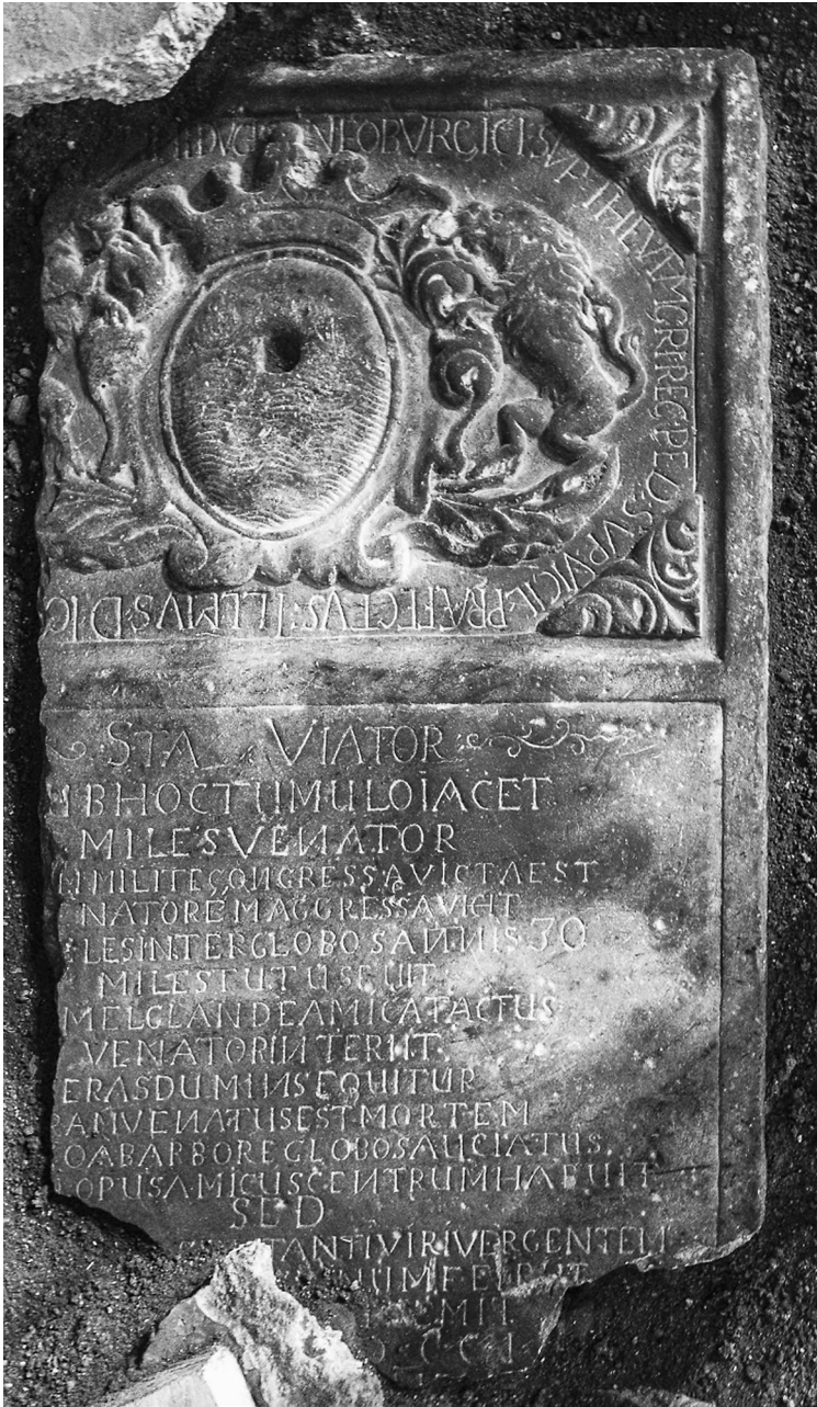
A sírkő fő tömbje a megtalálásakor a templom északkeleti sarkában