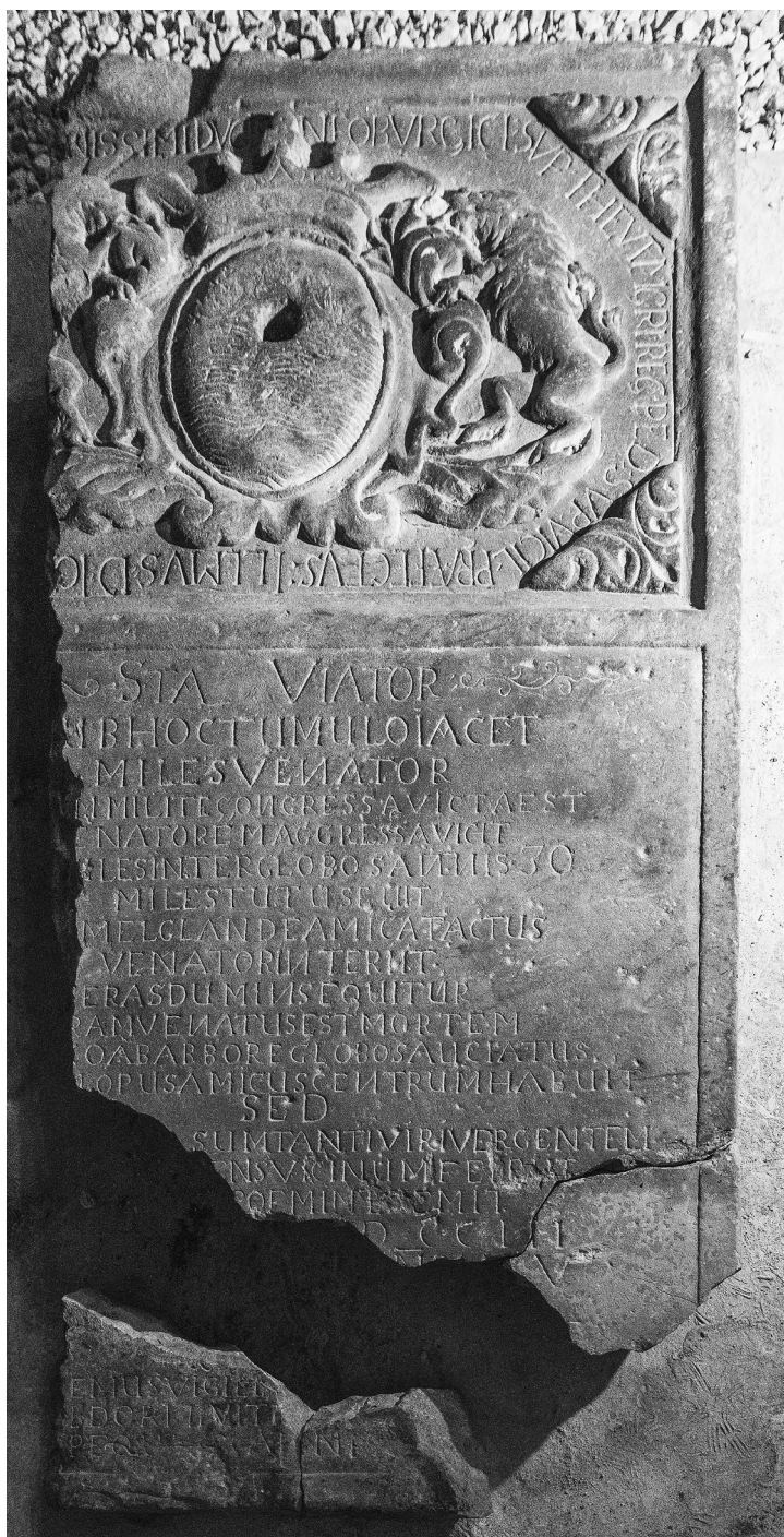
A sírkő megtalált négy darabja a kiemelés után