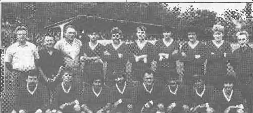
Pest megyei II. osztályban a csapatunk: 1988. év

Ellenzavazat nélkül elfogadta az elnökség. Minden területen hasznos volt a létszámemelés, mert több mérkőzés, több bevétel és a kiesési harc sem lesz olyan éles. A serdülő bajnokságba belépett a Nagykörsi