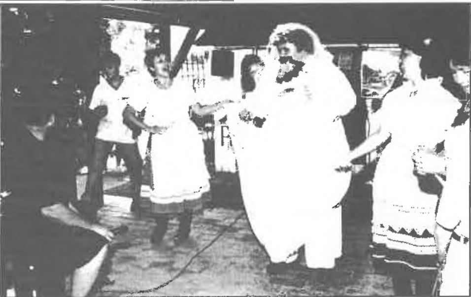
"Eladó a menyasszony"