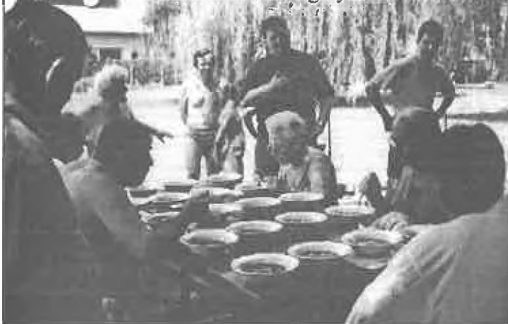
Munkában a csúri a gulyásfőzés versenyén

Majdnem mindenki jónak tartotta a programokat. Az ötlettel mindenki egyetértett,