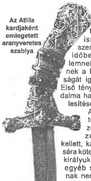
Az Atilla kardjaként emlegetett aranyveretes szablya