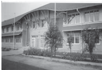
Tiszatenyői Általános Iskola

- A tantermeken kívül jól felszerelt nyelvi labor, számítástechnika terem biztosítja az informatikai ismeretek alapozását. A tanulók az alábbi szakkörök, klubok közül választhatnak: báb, színjátszás, rajz, környezetvédelem, énekkar, sport, néptánc és modern tánc. Ingyenesen elérhető az internet, melynek mindennapi használata elősegíti az információhoz jutást. Kihelyezett zenei oktatás is működik. Egy évvel az iskola átadása után elkészült a tornaterem is, mely a gyermekek mellett szívesen fogadja a sportolni vágyó felnőtteket is. A tágas alula alkalmas közösségi rendezvények lebonyolítására is. Ezen kívül szépen berendezett természettudományi előadóterem, modern sportudvar, tanakonyha, technika terem, orvosi szoba, ebédlő, büfé és 9000 kötetes könyvtár várja a diákokat és a lakosságot. Az iskolának