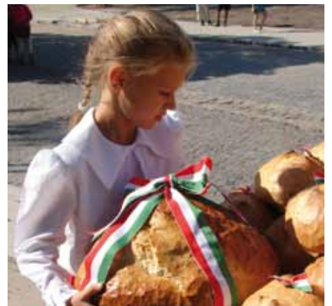
Cikk a 7. oldalon.