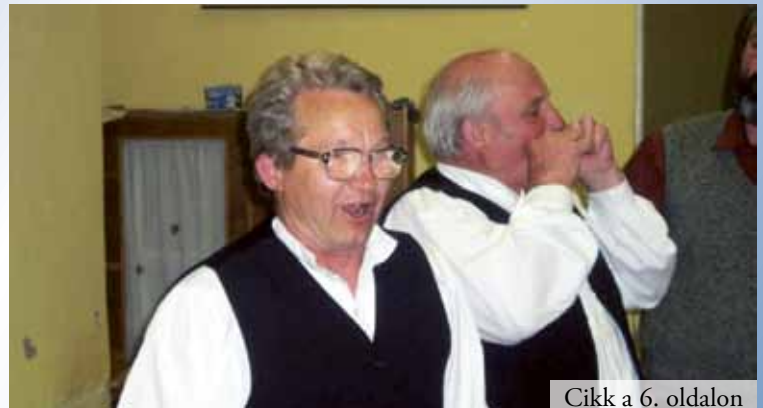
Cikk a 6. oldalon