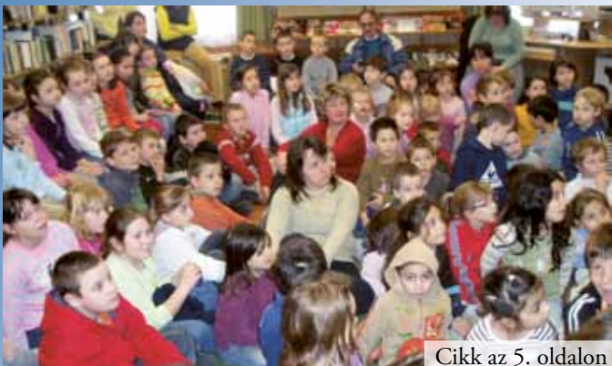
Cikk az 5. oldalon