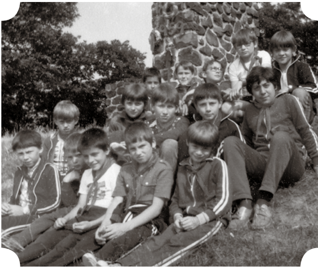
A fotó 1982-ben készült