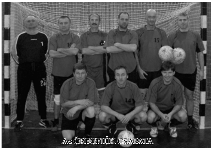
AZ ÖREGFIÚK CSAPATA

Bármikő Bt. Strand Kisvendéglő csapata megrendezte a II. Amatőr Labdarúgó tornáját 6 csapat részvételével az abonyi városi sportszarnokban.