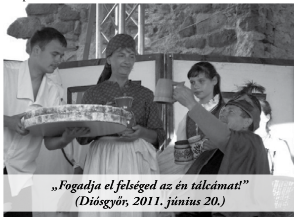
„Fogadja el felséged az én tálcámat!” (Diósgyőr, 2011. június 20.)