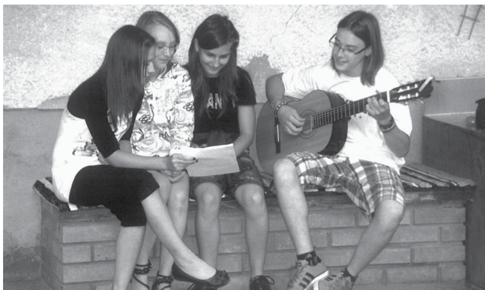
„Csillag születik” Színkörös buli 2011. június 25.

A Nagyabonyi Színkör a Bécsi diákok 2011. március 15-i bemutatója után is, a társulat 2011. március 23-ai Közgyűlésének döntése értelmében nyári szünet nélkül folytatja munkáját. Az előadás értékelését a tagok sorainak a rendezése követte, majd a nyári terveket egyeztetjük.