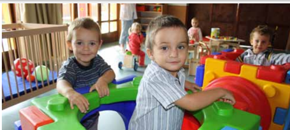
Varázslatos birodalom Cikk a 4. oldalon