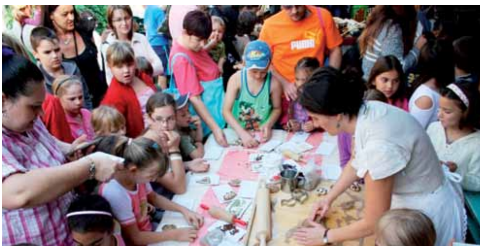
Sikeres kézműves nap a Múzeumban Cikk a 6. oldalon