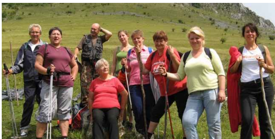
Tíz nap tündérorszámban Cikk a 7. oldalon

Az idősek napja alkalmából szeretettel köszöntjük a szépkorúakat az alábbi verssel: