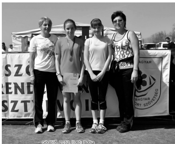
Gödöllő, 2013.