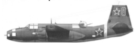
6. ábra: A-20G-15-DO Boston, A.A.F. S/N: 42-54220, 5. légi hadsereg, 218. bombázó-hadosztály, 452. "budapesti" bombázó-csoport, 1. (piros) század, 1944. tele, Acsa és Debrecen repülőtere.