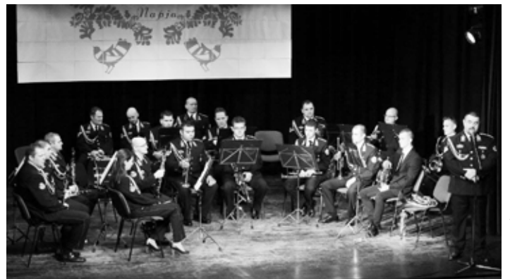
Fotó: Borsányi János