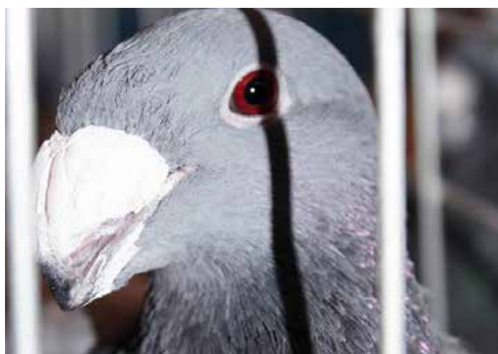
Fotó: Járdány Vanda, Borsányi János, Montázs: Fajka Zsuzsanna