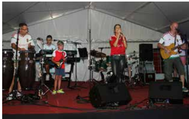
Cikk: Jandácsik Pál

Egész nap árusok vártak az érdeklődőket. A művelődési ház célja, hogy a Tó partyval, illetve a főzőversenyyel hagyományt teremtsen. Az utóbbira több mint harminc csapat jelentkezett, és még a határon túlról is érkeztek vendégek. Az ehhez hasonló rendezvények kohéziós erővel bírnak, kiváló csapatépítők, ahol új ismeretségek, barátságok születnek. Az Ízek utcája elnevezésű ceglédi programon ( bővebben a 15. oldalon ) már propagálták a Főzőversenyt a környező települések lakosainak, amely növeli a város nivóját és terjeszti a helyi értékeket.