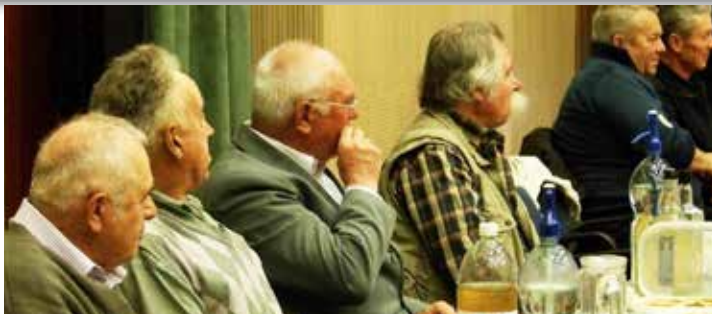
Városi Borverseny és Pogácsasütő Verseny