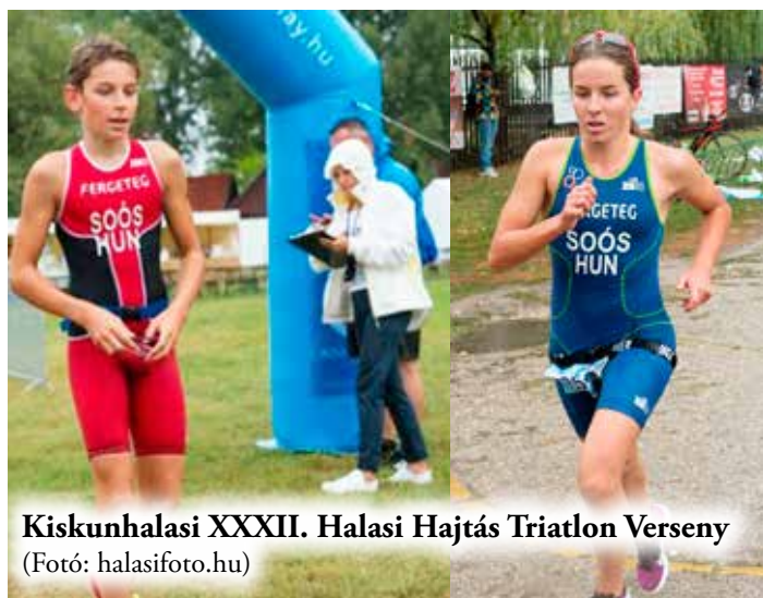
Kiskunhalasi XXXII. Halasi Hajtás Triatlon Verseny