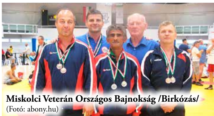
Miskolci Veterán Országos Bajnokság /Birkózás/