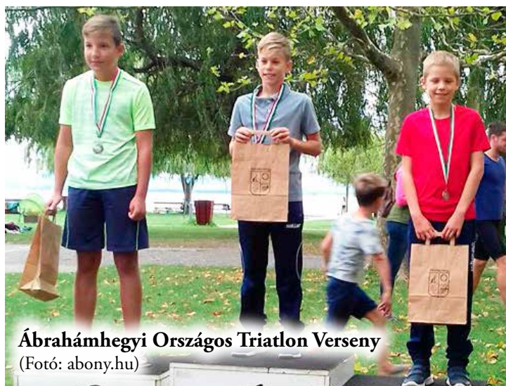
Ábrahámhegyi Országos Triatlon Verseny