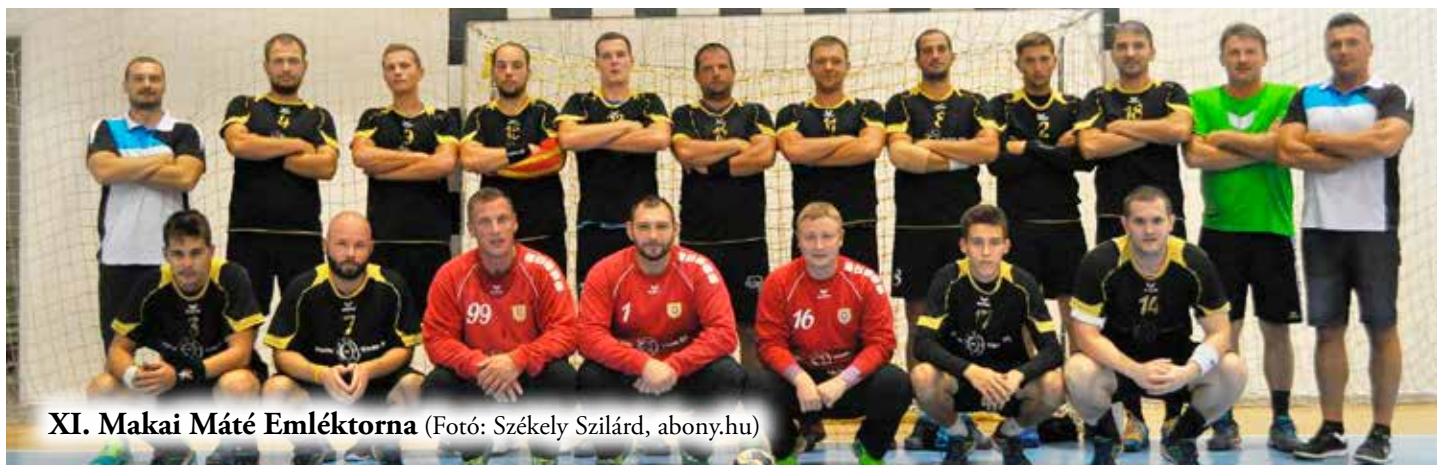
XI. Makai Máté Emléktorna