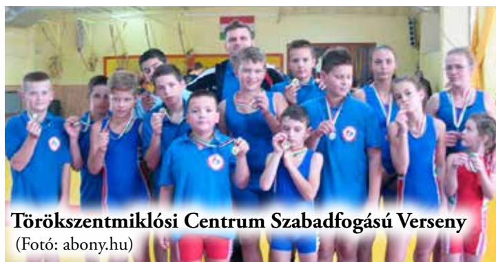
Törökszentmiklósi Centrum Szabadfogású Verseny