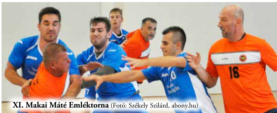
XI. Makai Máté Emléktorna