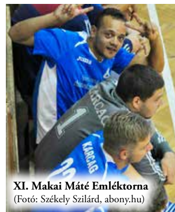
XI. Makai Máté Emléktorna