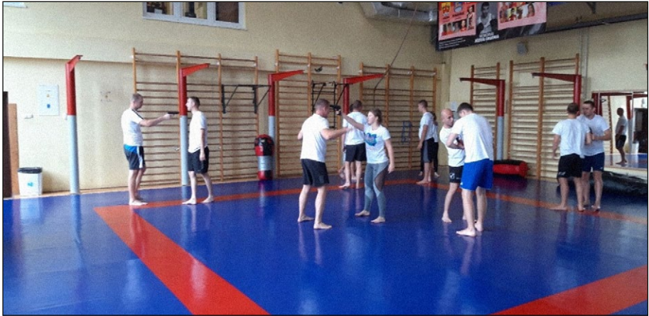
3. számú ábra: Önvédelmi foglalkozás, Szczytno.