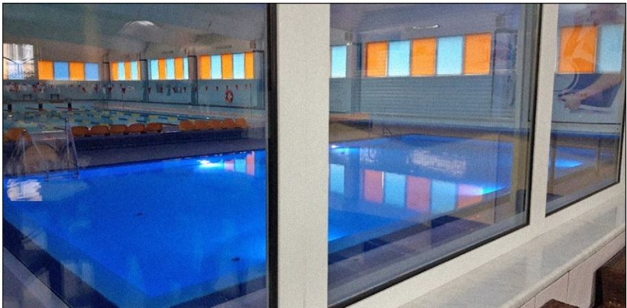
4. számú ábra: Uszoda, Szczytno.