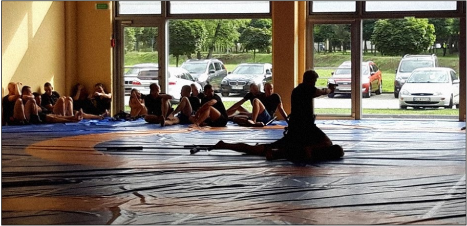
1. számú ábra: Intézkedéstaktikai „témazáró” vizsga, a támadó földre vitele, megbilincselése egyedül, Legionowo.