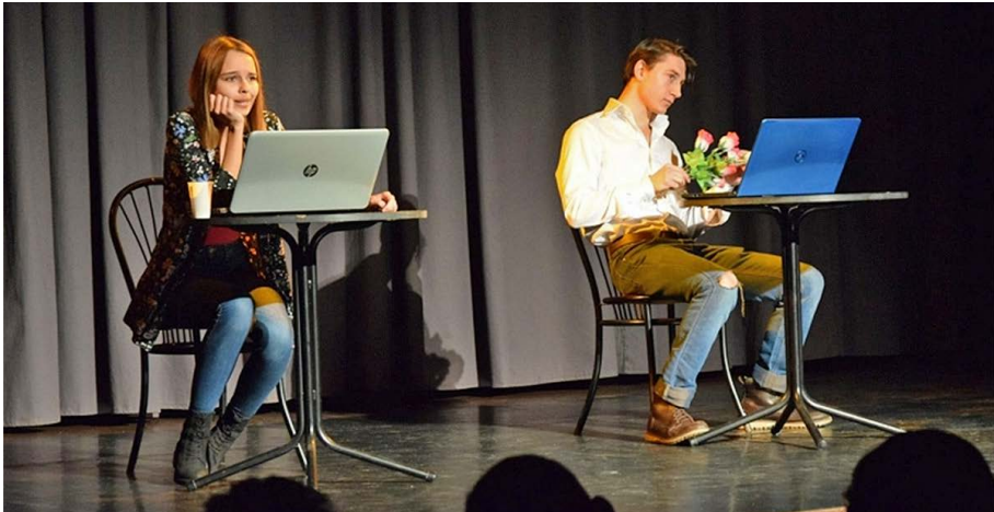
Forrás: Pest Megyei Rendőr-főkapitányság Bűnmegelőzési Osztály munkatársai által készített előadásfotó – „Hálózat-On” című előadás.

Az előadást követően interaktív előadás formájában beszéltek át a meghívott diákokkal a darabban is megjelenő online követés, a selfitis jelenség problémáit. A darab az internetes bűnözést, az interneten elkövethető bűncselekményeket