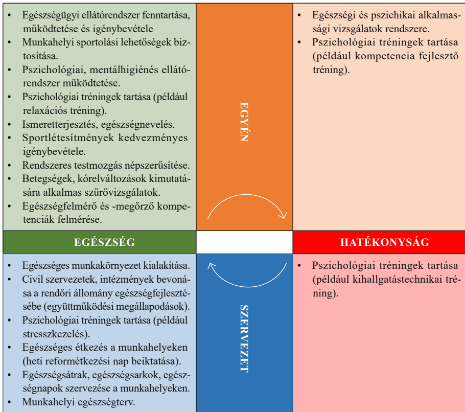
3. számú ábra: Az Élet-Erő-Egészség Program Malét-Szabó tevékenységi alapmodell rendszerében

A tevékenységi alapmodellben feltüntetve a program elemeit a következő ábra vázolható fel.