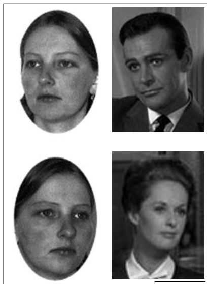
4. kép: A baloldali fotók Calder és munkatársai (2002, Fig. 2.) neuropszichológiai vizsgálatában szerepeltek ingeranyagként, a jobboldali képkockák nézőponti beállítások részletei Hitchcock (1964) Marnie című filmjéből.

Ezek az eredmények egybevágóan az előzőleg bemutatott megállapításokkal, szintén arra világítanak rá, hogy a belső fokalizáció valamennyi vizuális kódját jellemző szereplői premier plán és a horizontális irányban képen kívülre irányuló szereplői tekintet jelentősen facilitálja a befogadó mentális folyamatait. Mit kezd vajon a befogadó a szereplő belső fokalizációjának vizuális kódjaiból származó információval? Itier és Batty (2009) összefoglalója rámutat arra, hogy a szemek és a tekintet milyen kiemelt szerepet kapnak az arc információinak feldolgozásában, a szociális kognícióban, az identitás azonosításában és az érzelem felismerésben. Calder, Lawrence és munkatársainak (2002) kutatása a tekintet irányának feldolgozásában és a mentalizációban részvevő idegrendszeri korrelátumok átfedő területeire (mediális frontális cortex) hívja fel a figyelmet, ami bizonyítja, hogy a két képesség, ahogy Baron-Cohen munkacsoportja is feltételezte, korrelál egymással. Ez alapján nagyobb bizonyossággal állíthatjuk, hogy a tekintet követésére irányuló figyelem együtt jár a megfigyelt személy mentális állapotából való információszerzési tendenciával, ami az empátiás folyamatoknak is alapja. Ez az érintettség Calder és munkatársai tanulmánya alapján szignifikánsabban megjelenik, ha az ingeranyagként szolgáló fotón szereplő személy nem egyenesen a kamerába néz, hanem vízszintes irányban képen kívülre szegezi a tekintetét, ami egybevág a nézőponti beállításra jellemző ábrázolásmóddal (4. kép).