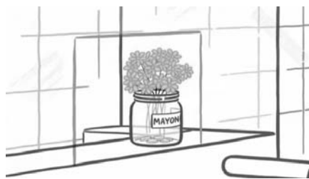
2. kép: A nézés tárgya (object/point). Amüt lát.