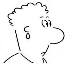
1. kép: A tekintet forrása (glance/point). Aki néz.