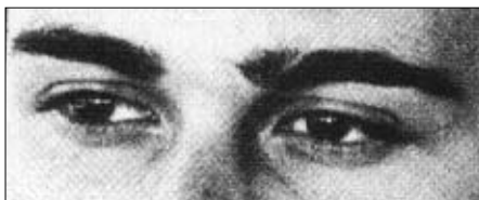
3. kép: Mind-In-The-Eyes teszt egyik tétele* A vizsgálati személynek a képen látható személy tekintetéből annak érzelmi állapotát kell kiolvasnia és választania a négy megadott lehetőségből (Baron-Cohen 2001).

fele-fele arányban szerepelnek. A teszt előfeltevéseiben azzal az implicit tudással találkozhatunk, amit a filmművészet nagyon régóta használ: ha egy szereplő tekintetét közel hozza a beállítás a nézőhöz, akkor nézőt arra facilitálja, hogy belépve a fikció terébe elkezdjen a szereplő érzelmi állapotáról gondolkodni. Ez irányú képességünkben viszont nem vagyunk egyformák.