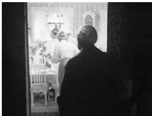
6. kép Ingmar Bergman (1957): A nap vége

tartalmak válnak megragadhatóvá, amelyhez a filmelemzés nem fér hozzá. Bizonyos filmek különösen hívják ezt az álomfejtésre alapuló értelmezési módot. Azokban az esetekben, amelyekben a film cselekménye nem a hagyományos felépítést követi, rendhagyó, nem logikus kapcsolatban álló jelenetekből áll össze, többlet jelenítés feltárásához vezethet egy álomanalógiát felhasználó értelmezés. Például Palombo (1995) értelmezése Greenaway Prospero könyvei -ről, Letzner és Ross (2005), illetve Vaida és Wildman (2005) értelmezései David Lynch Mulholland Drive -járól vagy Cowie (2001) tanulmánya Bergman A nap vége és a Persona című filmjeiről.