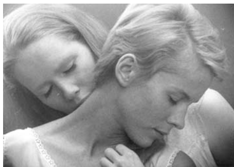
7. kép Ingmar Bergman (1966): Persona

A hazai vonatkozásokat tekintve Szabó Z. Pál (2003) Az andalúziai kutya tanulmánya, Stark András (2008) Bergman, Antonioni és Tarkovszkij elemzései és Erdélyi Ildikó (2012) Álmok című filmről készített értelmezései emelhetők ki, akik az álomfejtés pszichoanalitikus stratégiáját alkalmazva tárják fel az egyes filmek mögöttes tartalmát, jelentésrétegét.