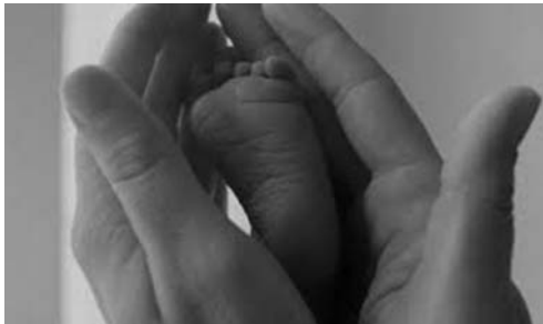
1. kép Terrence Malick (2011): Az élet fája

(Halász és Bódizs, 2001). Hartman (2008) vizsgálata az ún. nagy álom – azaz a jelentőségteljes, emlékezetes, nagyhatású álmok – legfontosabb ismertető jegyeit kutatta. Állítása szerint a nagy álom egyik legfőbb jellegzetessége, hogy rendelkezik egy erőteljes központi képpel, ami köré szerveződik az álom többi része. Maga Freud is részletesen kitér a manifeszt álom kifejezésrendszerének saját törvényeire, miszerint a látens gondolatoknak, jelentéseknek képekben kell kifejeződniük. Az ábrázolhatóság figyelembevételének követelménye alapján az álomgondolatok válogatáson, átalakuláson esnek át, s így elsősorban képek formájában válnak reprezentálhatóakká. Ennek két következménye van: a vizuális ábrázolásra alkalmas kapcsolatok előnyben részesülnek, és kiesnek a logikai kapcsolatok, vagyis az eltolásokat képszerű helyettesítők felé irányítja (Freud, 1900). Az ábrázolhatóság követelménye rárimel Balázs Béla azon megállapítására, miszerint „A film a felület művészete...a filmen is minden csak azon áll, hogy sikerül a rendezőnek a jelenetet képekben megragadni...” (Balázs, 1924, 28.). A vizuális ábrázolásmód, a képi kifejezés jelentőségét jól mutatja például Az élet fája (Terrence Malick, 2011) című film alábbi filmképe, amelyben a születés-jelenetben a rendezőnek egyetlen képbe sűrítve sikerül megjelenítenie az újszülött gyermekhez fűződő apai érzésvilágot.