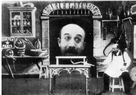
3. kép Georges Méliès (1901): L'homme à la tête en caoutchouc

a képzelet, az álom világába nyújtanak betekintést (Thompson és Bordwell, 2007).