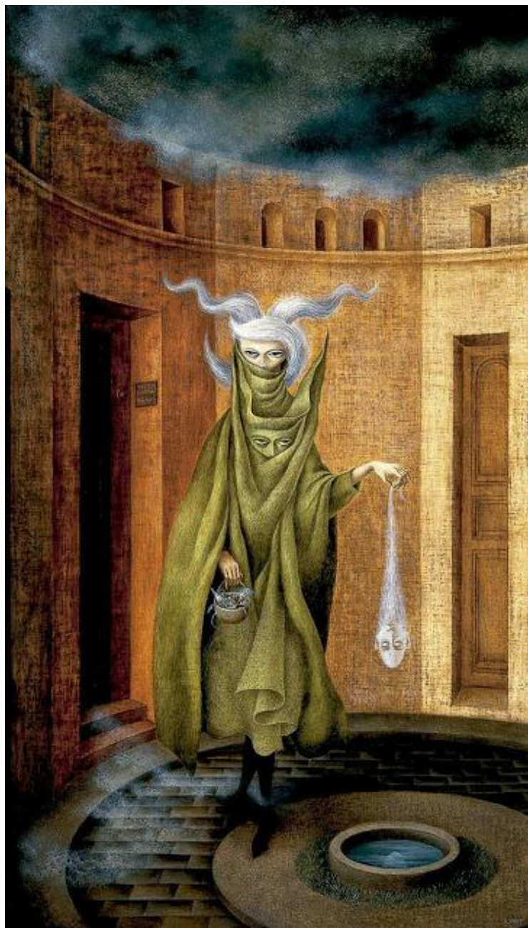
Remedios Varo: Az analitikustól távozó nő (1960)