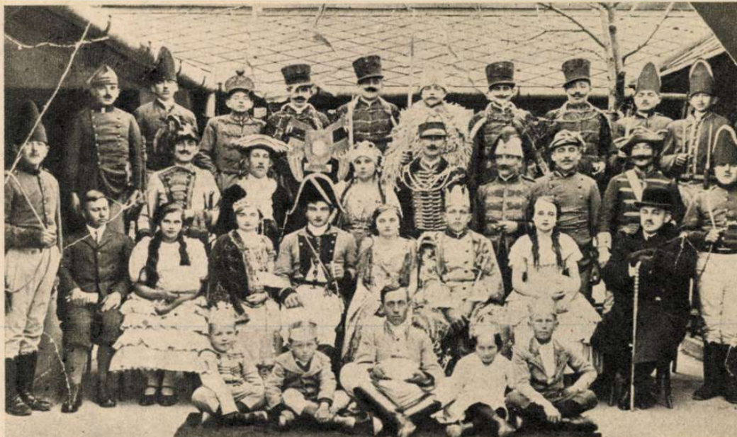
Negyven éve, 1929-ben mutatták be a csákvári Magyar Földműves Játékszín tagjai a budapesti Nemzeti Színházban Kodály Hány János című daljátékát.

Szülehet mese a meséről? Ami Csákvárott történt — úgy tetszik — azt mondja: igen. És úgy szülehetett, mint a hajdanvolt szerző verse, aki így kezdte regényes történetét: „ Új mellém a kandallóhoz, Fel van szítva melege... ” Kezében van egy emlékkönyv valamelyik csákvári borospince gazdájának hagyatékából. Rigmus rigmust ér benne, s mind a házigazda borát, vendégszeretetét magasztalja. Azt mondják, e vendéggönyv lapjai fölött egyezett meg Paulini Béla és Harsányi Zsolt, hogy a csákvári parasztszínházi adottságaihoz igazítja a Kodály daljáték szöveggönyvét. Justh Zsigmond múlt századi parasztszínházi kötetre menő cikk, tanulmány, visszaemlékezés foglalkozik. A csákvári vállalkozás — talán a Paulini személyét egykor beárnyékolta előítélet miatt? — feledésbe merült.