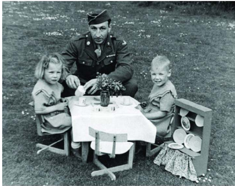
7. kép: A Plan (eredetileg Foster Parents Plan); engedéllyel közölve.

Anna Freud és munkatársai megfigyelték, hogy az apa nélkül nevelkedő gyerekek gyakran kitalálnak egy fantázia-apát, aki vagy fantasztikusan jó, vagy szörnyen gonosz és agresszív. Martin esetében ezek a fantáziák jóval a háború után, kilenc éves korában váltak nyilvánvalóvá, amikor a Hampstead Gyermekklinikán (ma Anna Freud Központ) pszichoanalitikus terápiába kezdett járni. Evészavarai, antiszociális viselkedése és tanulási akadályozottsága (alig tudott írni és olvasni) miatt volt indokolt a kezelés (Hellman 1990, 50.). Martin hamar elmesélte a terapeutájának, hogy azért nem tud az iskolában koncentrálni, mert nagyon lefoglalja az álmodozás: „olyan sok van, akár egy évig is tarthatna”, mondta. A mindent átszövő fantáziák – melyek többsége az apa hiánya körül forgott – kidolgozottsága és mélysége éles ellentétben volt azzal a koragyerekkori megfigyeléssel, hogy akkoriban egyáltalán nem foglalta szavakba ezeket a fantáziákat. Ez utóbbit csak úgy értelmezhetjük, mint egy, a fantáziák intenzitása és félelmetes természete elleni védekezés eszközt.