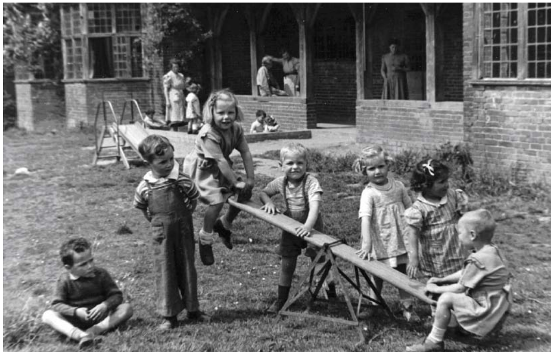
5. kép: A Plan (eredetileg Foster Parents Plan); engedéllyel közölve.

szeretné letagadni, ami történt – de mivel ez sosem sikerült teljesen, játéka szinte kényszeresen ismétlődött, egészen addig, míg néhány hónappal később végre képes volt beszélni édesapja haláláról (i. m. 197.).