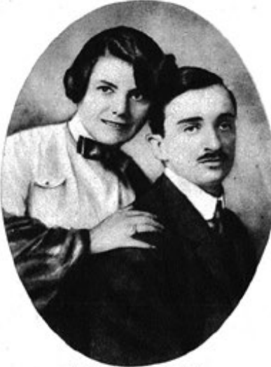
Róheim Géza és felesége

Amíg az expedíció olyan stádiumba jutott, hogy útrakészen állottunk, öt-