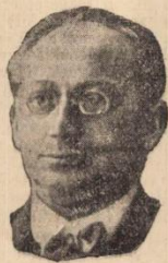
Dr. Ferenczi Sándor