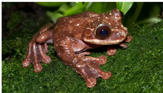
Toughie (Nehézfiú), az Ecnomiohyla rabborum nevű panamai rojtos végtagú levelibékafaj utolsó ismert példánya 2016. szeptember 26-án pusztult el az Atlantai Botanikus kertben.

hogy néhány egyedet életben tartunk, vagy a halálból visszahozzuk őket. [...] Egy fontos értelemben nem állunk még készen a de-extinction re – ha egyáltalán valaha készen fogunk állni. // A jelen időszak inkább önmagunkkal, mint a tömeges kihálás okozóival való őszinte számvetést igényel. Röviden, gyászolnunk kell, kis időt a halottal tölteni, megőrizni hitünket életükkel és halálukkal kapcsolatban, hogy megismerjük a világ valóságát, amelyet alakítunk.” (van Dooren és Rose, 2017, 377.)