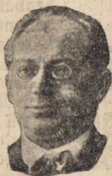
Dr. Ferenczi Sándor

Az organikus szív, illetve a betegségeket, amelyek szívfájdalommal járnak, ez a rövid cikkeknek nem akarja tárgyálni. Itt csak arról a szívfájdalomról lesz szó, amely ideges termé-