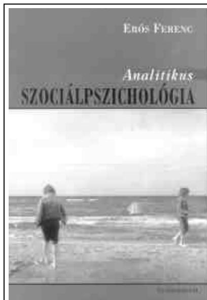
Erős Ferenc: Analitikus szociálpszichológia . Új Mandátum, Bp. 2001.

Ma már talán nem szorul külön igazolásra – Magyarországon sem – az analitikus szociálpszichológia létjogosultsága. A pszichoanalízis ugyanis egyike a modernitás nagy kulturális narratívumainak. Freud fellépése a tizenkilencedik század végén nem csupán egy lélektani felismerést, a tudattalan felfedezésének betetőzését és egy új terápiás eljárás, a terapeuta és a páciens dialógusán alapuló gyógy mód kidolgozását jelentette, hanem egy diszkurzivitás megalapozását is. Freud – Michel Foucault kifejezésével – azon szerzők közé tartozik, akik „megteremtették más szövegek kialakításának lehetőségét és szabályait”, és „diskurzusok végtelen lehetőségét” hozták létre. Az ilyen szerzők Foucault szerint „teret nyitottak valaminek, ami más, mint ők és mégis beletartoznak abba a diskurzusba, amelynek ők voltak a kezdeményezői”.