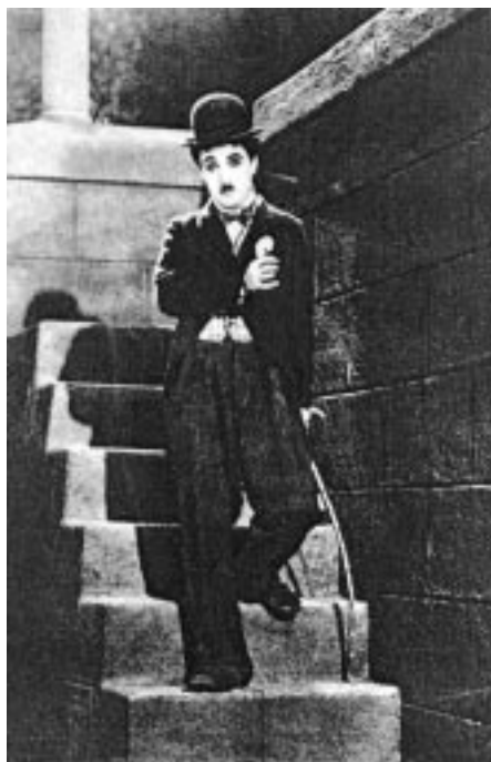
Chaplin a világhírű vált csavargó figurájában

adok-kapok történések és végeláthatatlan üldözések zajlottak. Később (a First Nationalban 1917-től 1923-ig) már önálló történeteket írt, melyeket ő rendezett és a főszerepet is ő játszotta. A „Chaplin mint rendőr”-ben („Easy Street”, 1917) a kis ember a nagy bűnöző tömeggel szemben próbál rendet teremteni, amiből végül is győztesen kerül ki. „A gyógyforrás”-ban („The Cure”, 1917), részeg alkoholistaként beleönti italait a gyógyvízű forrásba, amitől az egész szálloda berúg. Az egyik legnagyobb sikerét a „A kölyök” („The Kid”, 1921), című művével aratta, amiben egy elhagyott csecsemőt nevel fel, akit a hatóságok el akarnak tőle venni. A kislány kemény harccal igyekszik magánál tartani és megvédeni. Ebben is a saját hányatott gyermekkorra tükröződik. A romantika, könnyű és mosoly változása is emeli a film művészi értékét. Művészete a barátaival önállóan