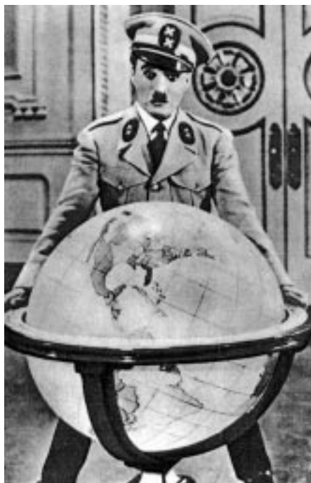
Chaplin mint diktátor

ról és a demokráciáról. Ez nem csupán művészi magaslat, de a maga korában igen bátor politikai-történelmi tett volt, amikor Amerika még nem állott harcba a náci Németországgal.